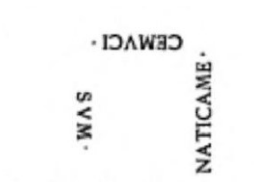
Figura 4. Natiga me Gemuci sum (Dressel, 1899: 867, n.º 6901)

ne atigas non sum tua M ... sum “no me toques, no soy tuya, soy de M” (n.º 6902)