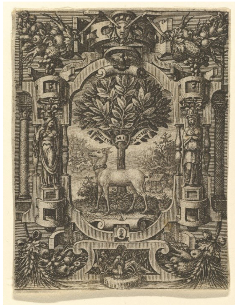
Figura 2. Emblema de Lucrecia Gonzaga por Giorgio Ghisi (The Met)

De la misma época es conocido el grabado del emblema de Giorgio Ghisi (anterior a 1566), que es mucho más elaborado que el que encontramos en el libro de Ruscelli. Como señala Suzanne Boorsch (1985), posiblemente fue el primero de los tres grabados existentes del emblema de Lucrecia Gonzaga y probablemente fue diseñado para un libro que nunca se publicó.