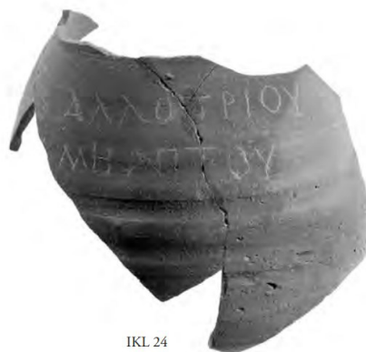
Figura 7. Fragmento de un jarrón con la inscripción incisa ΑΛΛΟΤΡΙΟΥ ΜΗ ΑΠΤΟΥ (Thür y Rathmayr, 2014, Tafel 125, IKL 24)

Otro objeto de mucho interés es un fragmento del jarrón encontrado en Éfeso con el grafito ΑΛΛΟΤΡΙΟΥ ΜΗ ΑΠΤΟΥ ( ἀλλοτρίου μή ἄπτου “de otro, no toques” 23 ). En cuanto a su datación, se trata de los siglos I-III según la tipología del jarrón y del último cuarto del siglo I o la primera mitad del siglo II según el contexto arqueológico (Waldner y Ladstätter, 2014: 567, K 984).